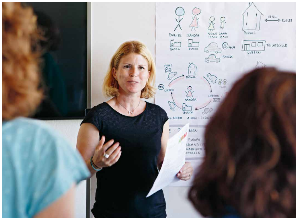
Die Moderatorin der KlimaGespräche erklärt den Teilnehmenden die nächste Übung.