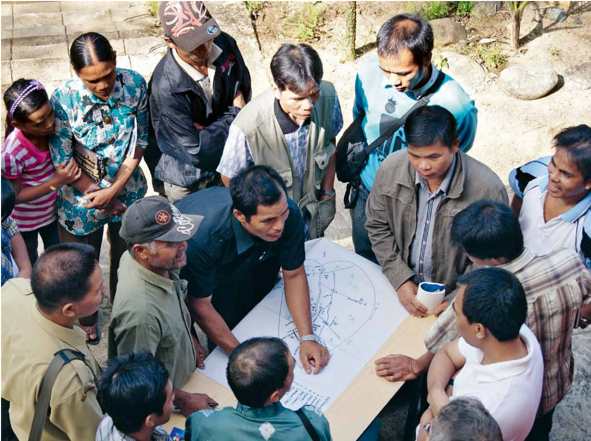
Die Bewohnerinnen und Bewohner von Silit begutachten die Karte, die sie mithilfe von Walhi und zum Schutz ihres Regenwaldes erstellt haben.

sich in festliche Sarongs gekleidet, die Männer nehmen die Karte sofort unter die Lupe. Sie zeigt den Grenzverlauf des Dorfgebiets, das eine Fläche von 40 Quadratkilometern umfasst, fast doppelt so viel wie die Stadt Basel. 70 Prozent davon sind unberührter Regenwald.