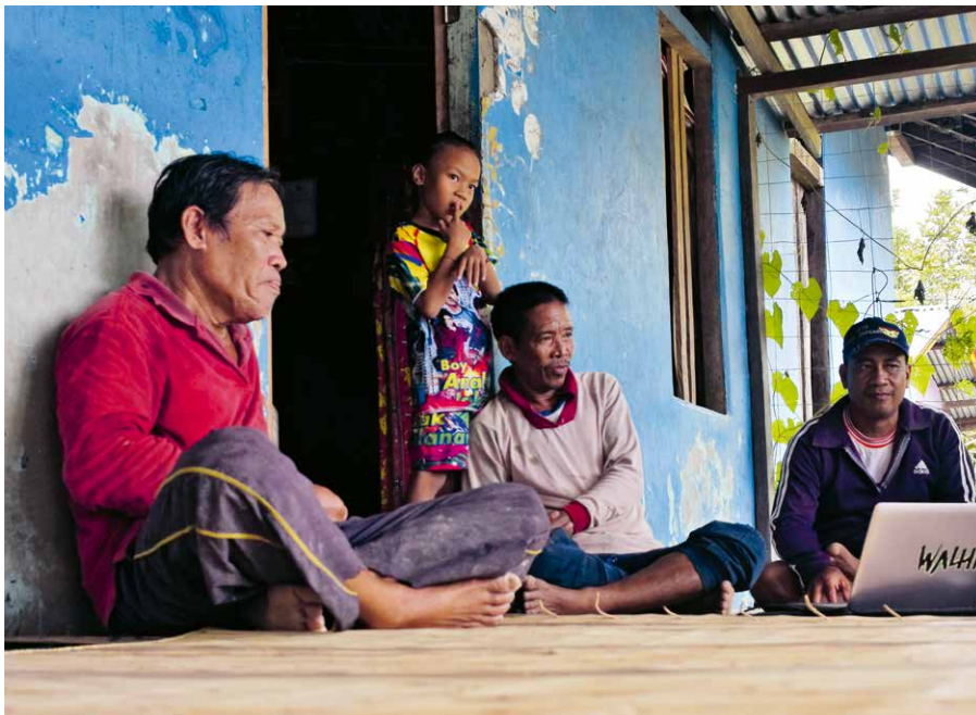
Gemeinsam mit Walhi werden die GPS-Daten auf dem Computer erfasst und zu einer Landkarte zusammengefügt.

Auf Borneo wächst der Widerstand gegen die Ölpalmpflanzungen. Dank der von Brot für alle unterstützten Kartierung gibt es erste Erfolge.