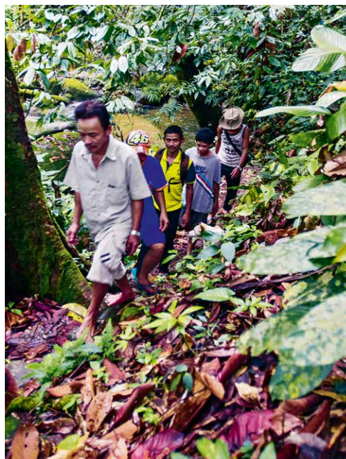
Schritt für Schritt kämpfen sich die GPS-Datensammlerinnen und -sammler durch den unwegbaren Dschungel.